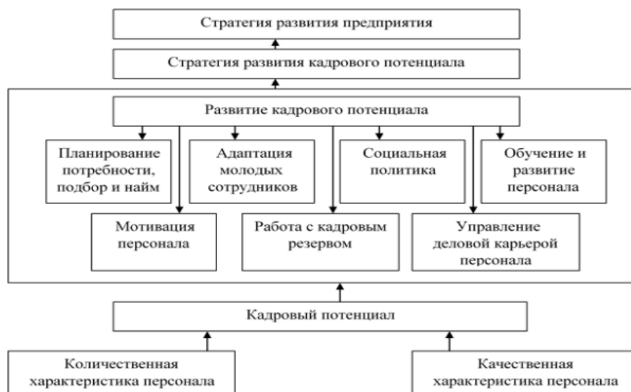
Рисунок 1 - Место развития кадрового потенциала в стратегии развития предприятия [6]

Коммуникативный компонент —представляет умение сотрудников выстраивать эффективное взаимодействие, работать в команде, создавая атмосферу доверия и синергии, где общий результат превосходит сумму индивидуальных усилий [4,5].