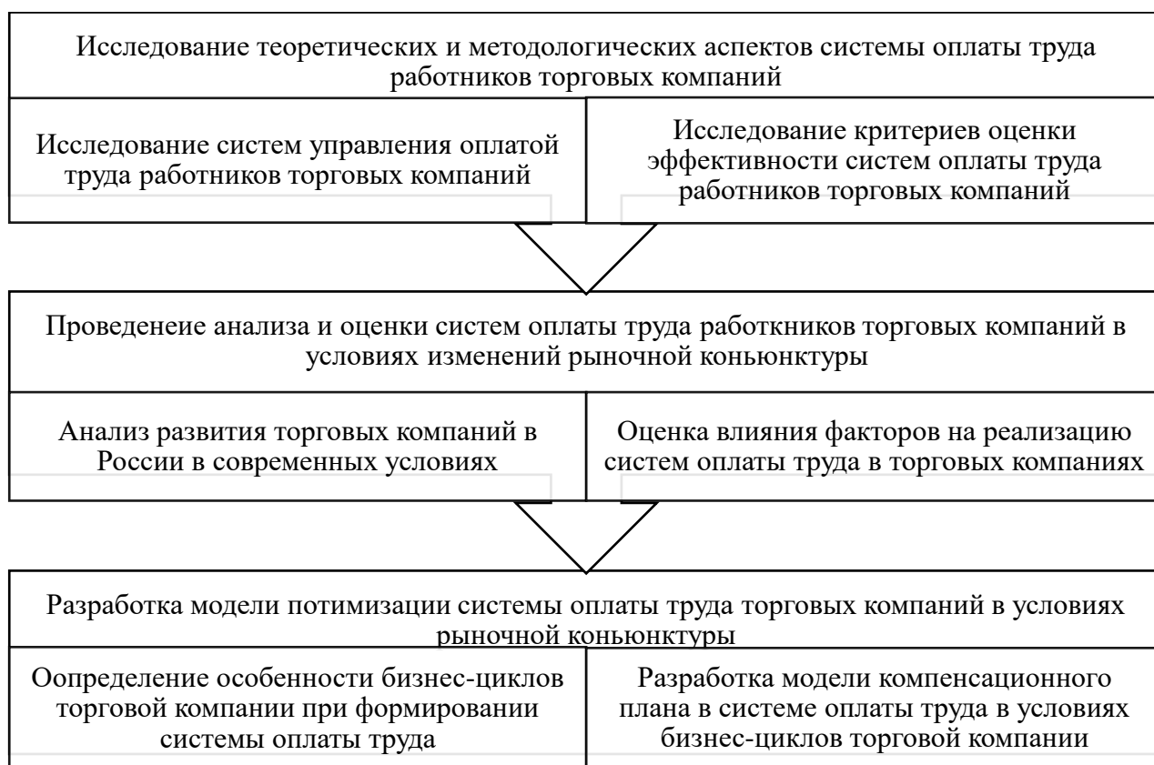
Рисунок 1 - Этапы исследования и подготовка к апробации результатов научно-исследовательской деятельности систем оплаты труда работников торговых компаний в условиях изменений рыночной конъюнктуры

На первом этапе исследования определяются теоретические и методологические аспекты систем оплаты труда работников торговых компаний в разрезе анализа особенности систем оплаты труда и критериев оценки их эффективности с позиции подходов различных отечественных и зарубежных авторов в академической и научной литературе. На основе проведенного анализа выделяются преимущества и недостатки форм оплаты труда для работников торговых компаний, конъюнктуры рынка происходит разработка концепции управления системой оплаты труда работников торговых компаний. Концепция выделяет субъекты управления, стратегию развития, объекты управления, ресурсы, механизмы и функции управления системой оплаты труда торгового предприятия, оценку эффективности реализации концепции. Разработанная концепция задает вектор диссертационного исследования разработки и апробации модели компенсационного плана в системе оплаты труда в условиях бизнес-циклов торговой компании.