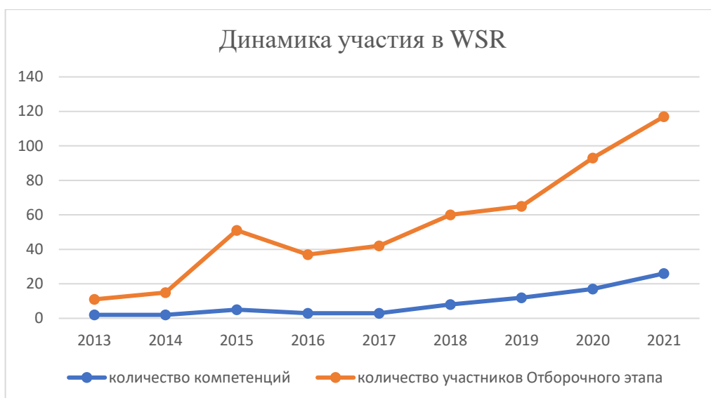
Рисунок 1 - Динамика участия в WSR

Стабильно высокие показатели у студентов по следующим компетенциям: