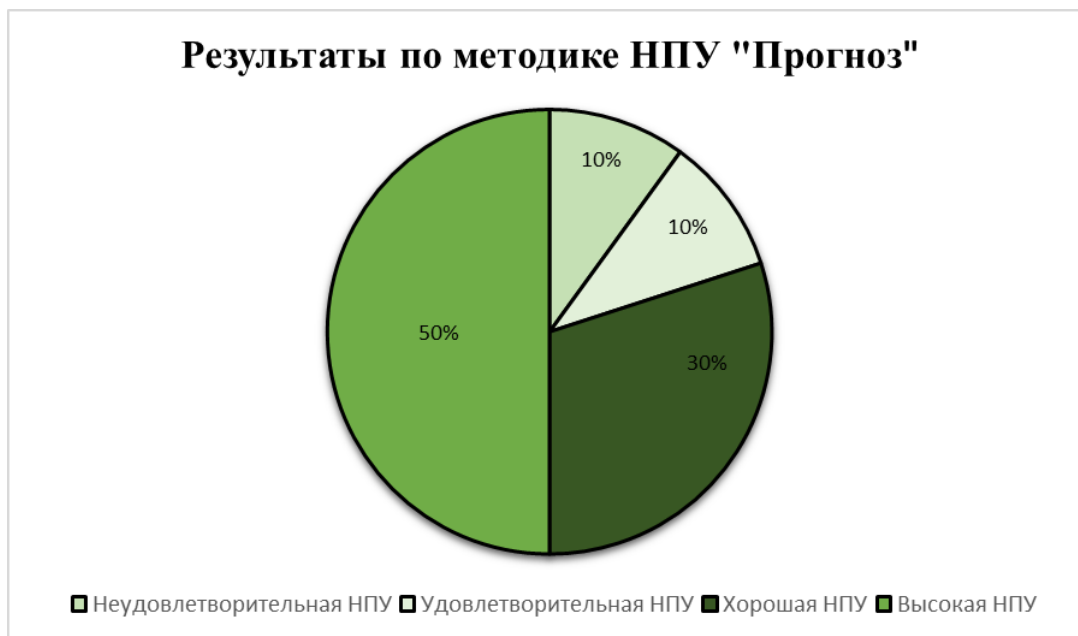
Рисунок 1 – Результаты диагностики по методике НПУ «Прогноз» В.Ю Рыбниковой (%)

С целью изучения нервно-психической устойчивости у сотрудников ОСП использовалась анкета «Прогноз» В.Ю. Рыбников, ее следующие шкалы: неудовлетворительная НПУ, удовлетворительная НПУ, хорошая НПУ и высокая НПУ. Результаты диагностики представлены на рисунке 1.